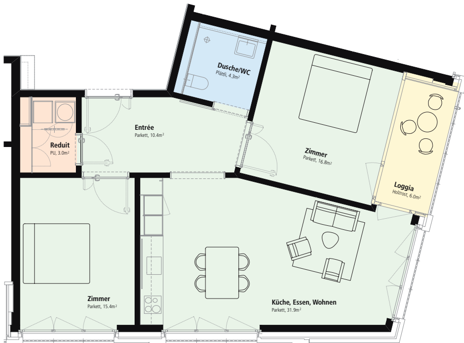
3.5-Zimmer-Wohnung Ecke Süd mit Loggia 81,8 m 2 Wohnfläche