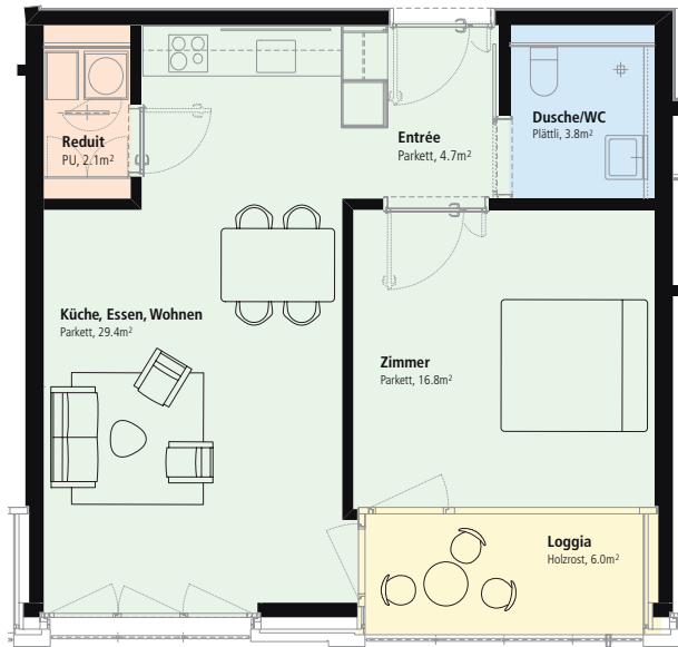
2.5-Zimmer-Wohnung Nordost mit Loggia 56,9 m 2 Wohnfläche